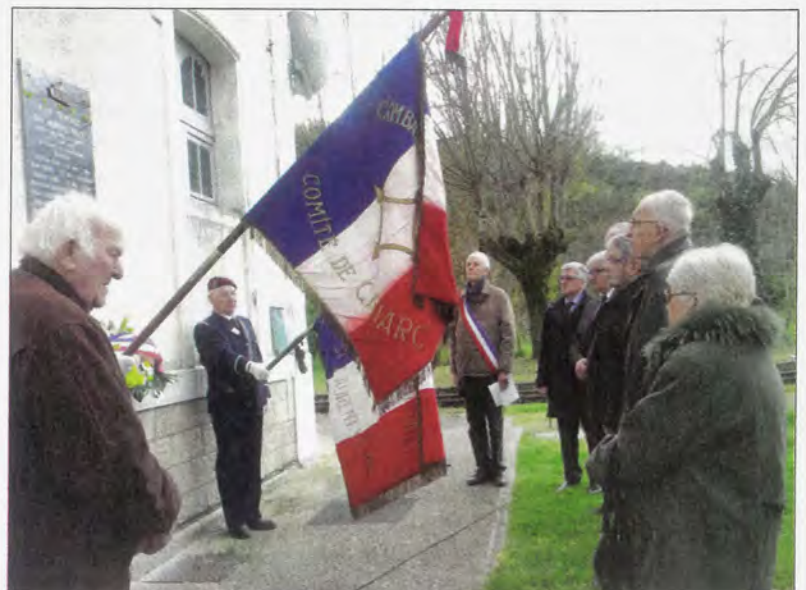
Ci-dessus : cantonniers, chef de section, chef de district, inspecteur Traction, les huit victimes figurent toutes sur la plaque commémorative.

Les pompiers de Cahors, qui s'étaient déplacés pour éteindre l'incendie, quittent les lieux. Soudain, les vapeurs d'ammoniaque, au contact des braises incandescentes de charbon, déclenchent une terrible explosion. Sept cheminots sont tués sur le coup, un huitième succombera à ses blessures.